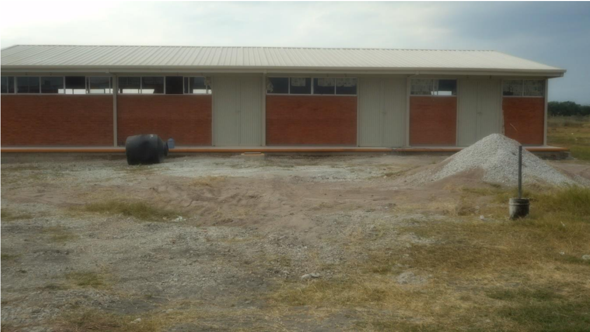
Taller T-80 en terminado.