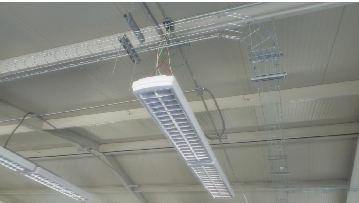
Taller T-80 en terminado; fuente archivo.