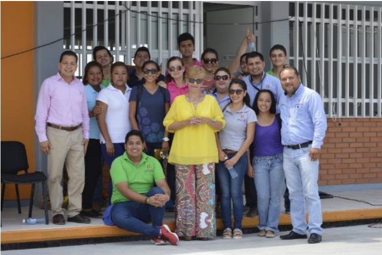
Comunidad universitaria Tamuín, fuente archivo.