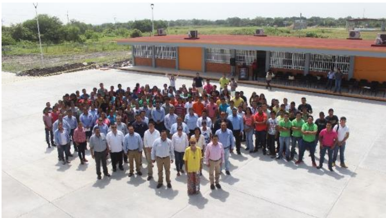
Comunidad universitaria Tamuín, fuente archivo.