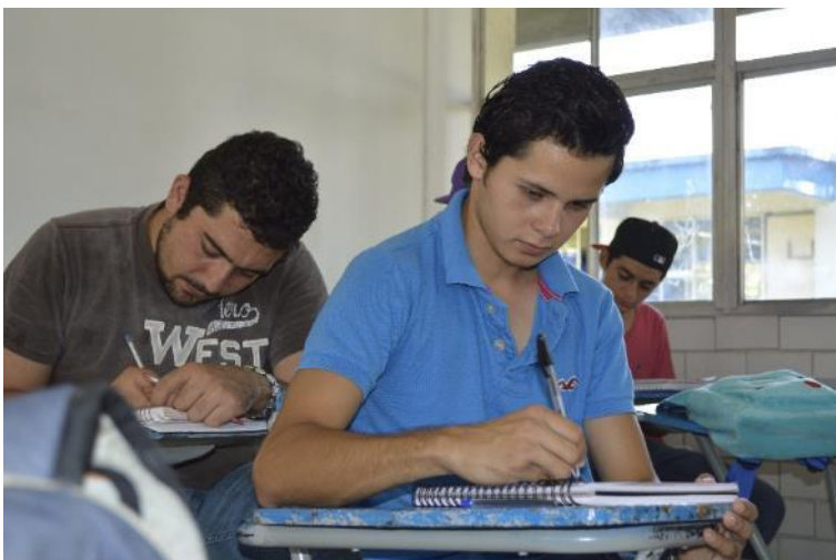
Comunidad universitaria Tamuín, fuente archivo.