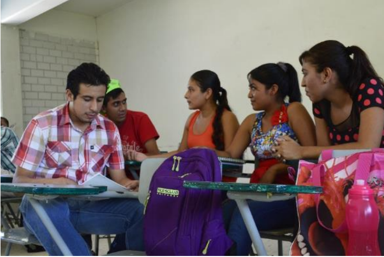
Comunidad universitaria Tamuín, fuente archivo.

carrera es de 20.2 años en la cual el 62 por ciento son alumnas; por lo que con esta inversión se busca seguir consolidando a la licenciatura, para que siga siendo una opción para los jóvenes del Estado.