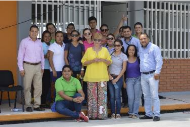
Comunidad universitaria Tamuín, fuente archivo.