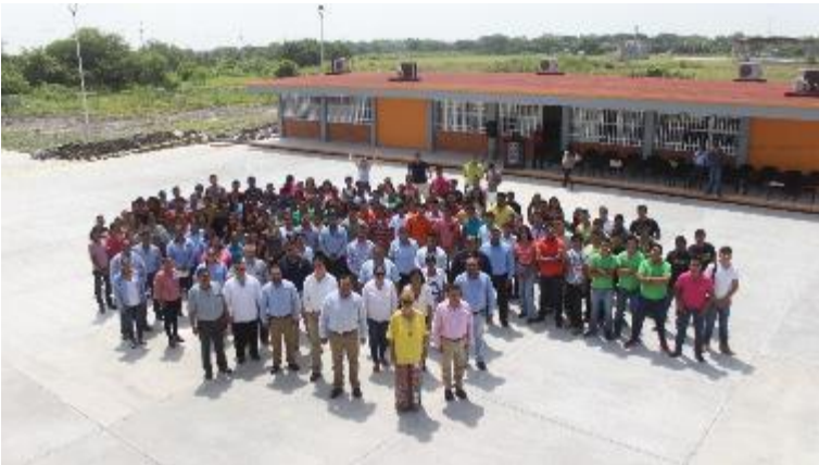
Comunidad universitaria Tamuín, fuente archivo.