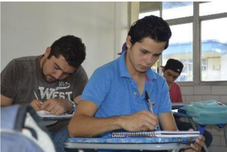
Comunidad universitaria Tamuín.