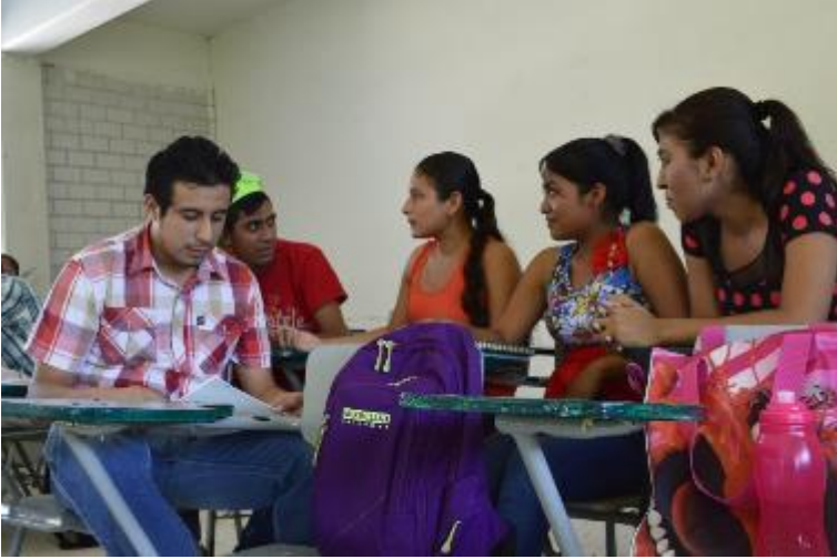
Comunidad universitaria Tamuín.

carrera es de 20.2 años en la cual el 62 por ciento son alumnas; por lo que con esta inversión se busca seguir consolidando a la licenciatura, para que siga siendo una opción para los jóvenes del Estado.