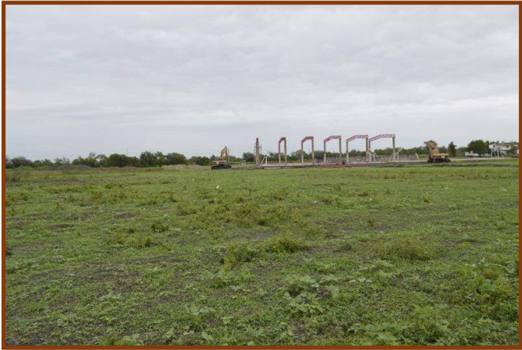
Predio a efectuarse la obra del fondo Expansión 2016.