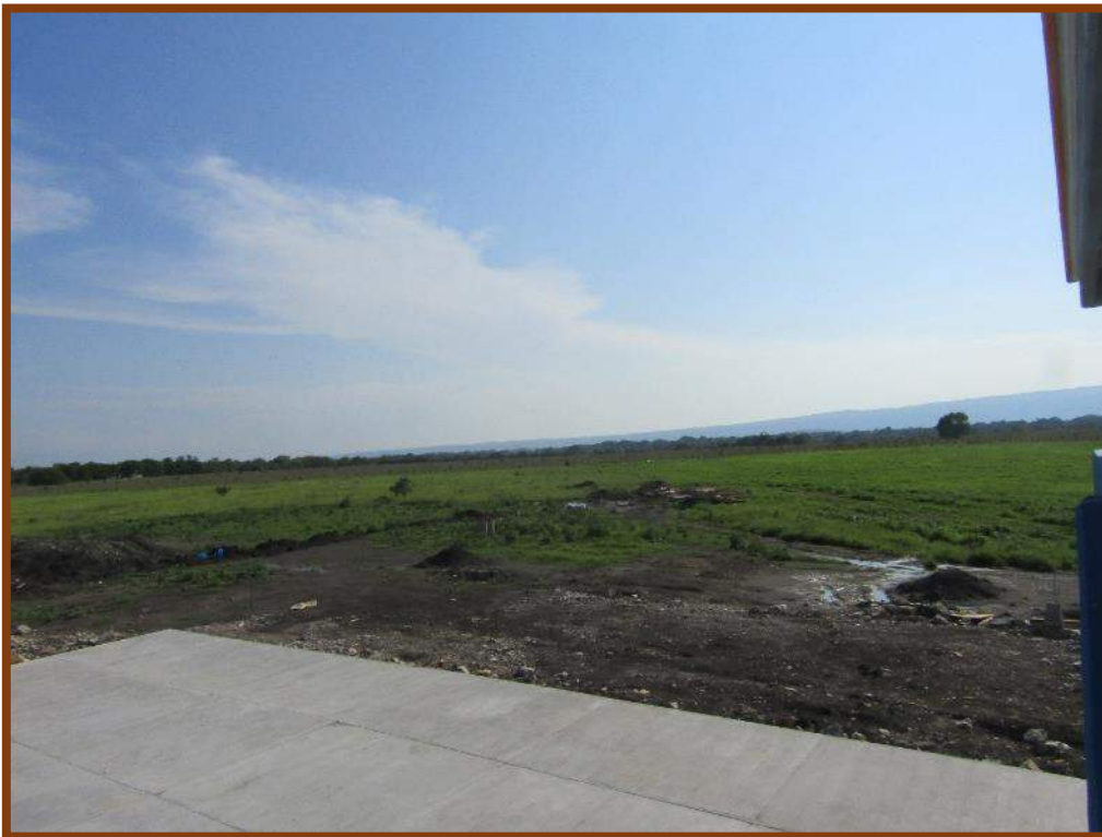
Predio a efectuarse la obra del fondo Expansión 2016.

“Por la diversidad cultural, riqueza de nuestra identidad”