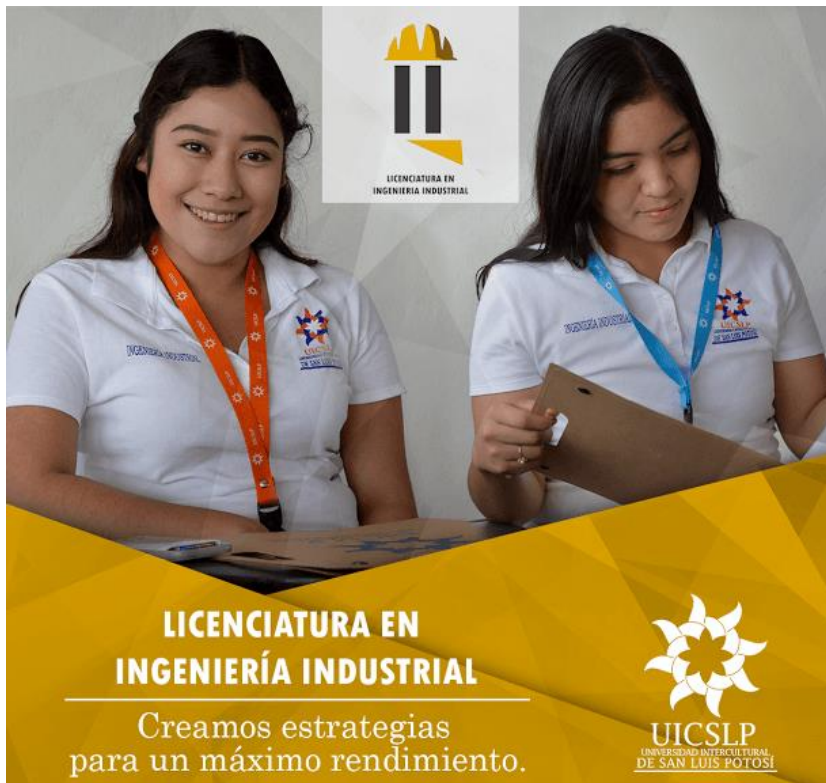
Alumnos de Ingeniería Industrial Tamuín, fuente archivo.

La institución entiende por interculturalidad un “momento social” de construcción de una renovada identidad integradora que pretende reconciliar los saberes ancestrales con las sociedades de conocimiento. Una articulación de valores filosófico-sociales que pueden ser catalizadores de una redistribución de los valores económicos, tecnológicos y sociales.