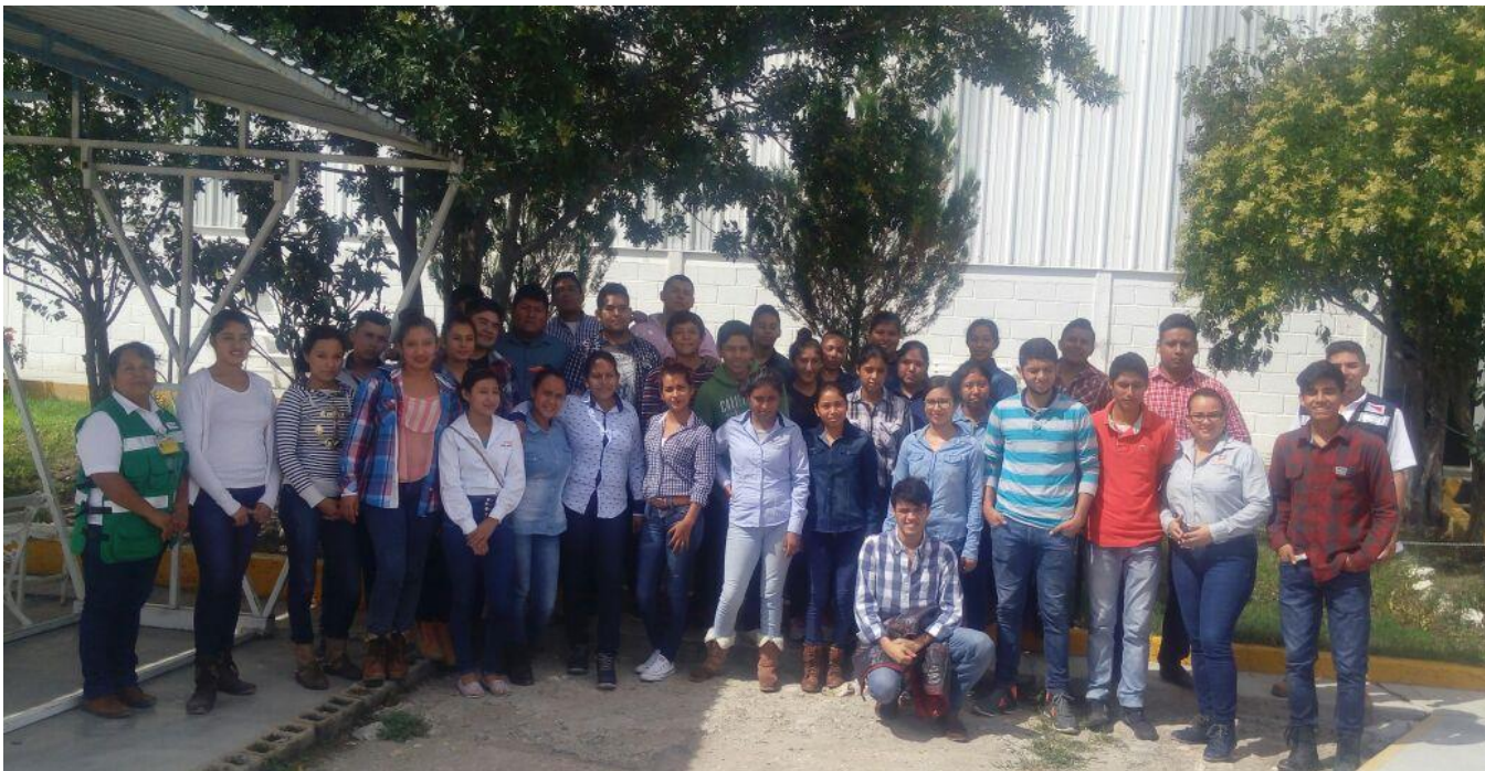
Alumnos de Ingeniería Industrial Tamuín, fuente archivo.