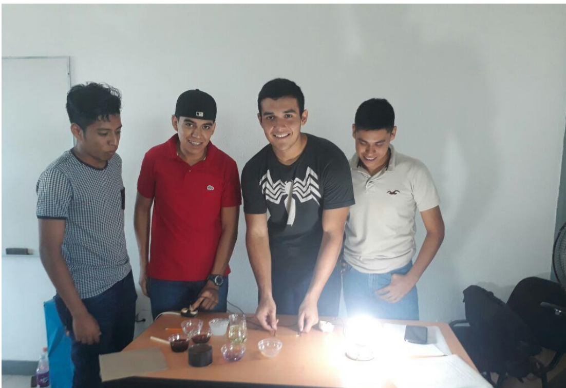
Alumnos de Ingeniería Industrial Tamuín, fuente archivo.