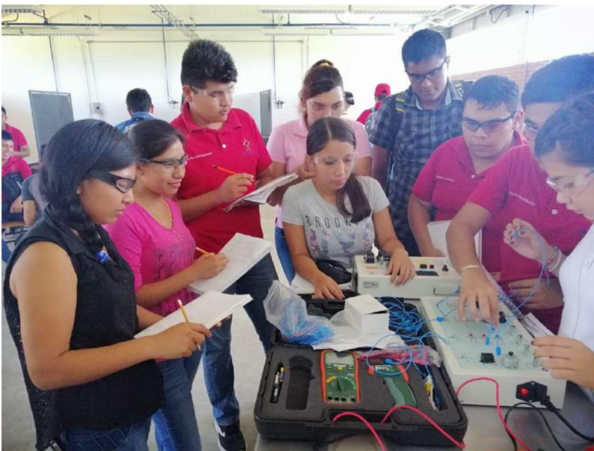
Práctica, Laboratorio campus Tamuín