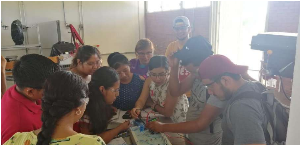
Práctica, Laboratorio campus Tamuín