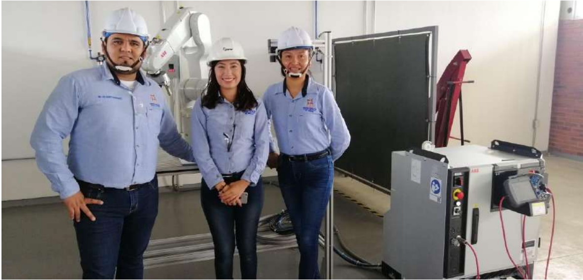
Práctica, Laboratorio campus Tamuín