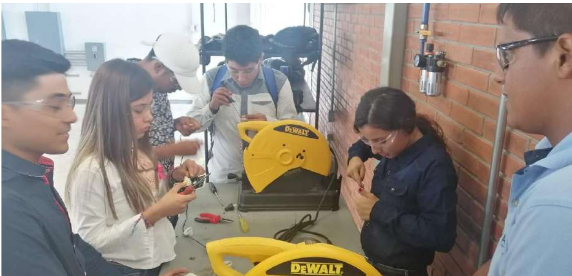
Práctica, Laboratorio campus Tamuín