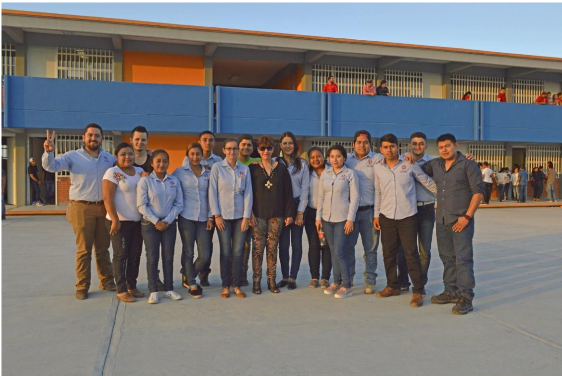
Comunidad Universitaria Unidad de Tamuín, fuente archivo.