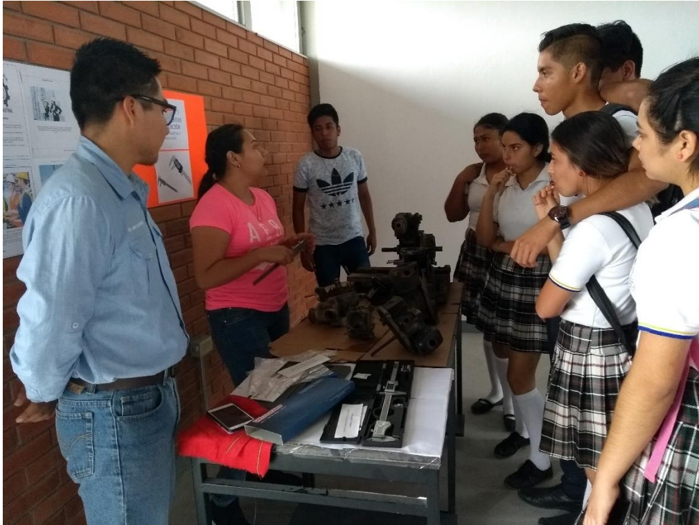
Actividades en taller T-80 Unidad de Tamuín.