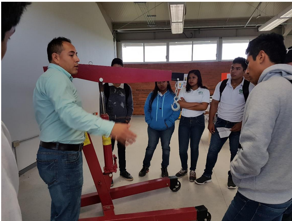
Actividades en taller T-80 Unidad de Tamuín, fuente archivo.