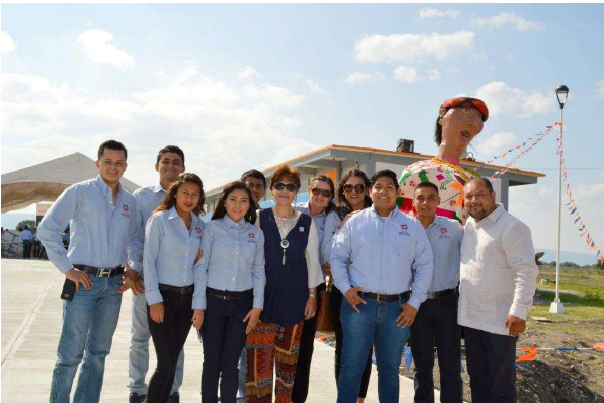
Comunidad Universitaria Tamuín, fuente archivo.