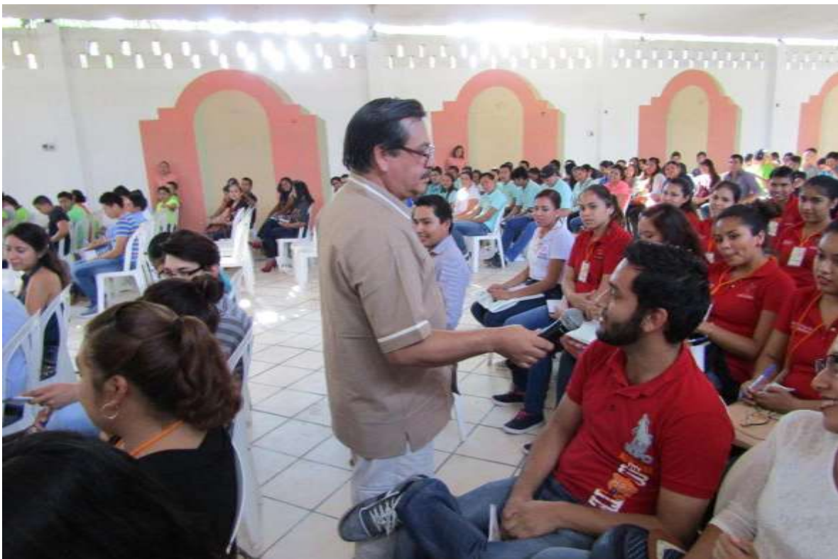
Alumnos de Ingeniería Industrial Tamuín, fuente archivo.