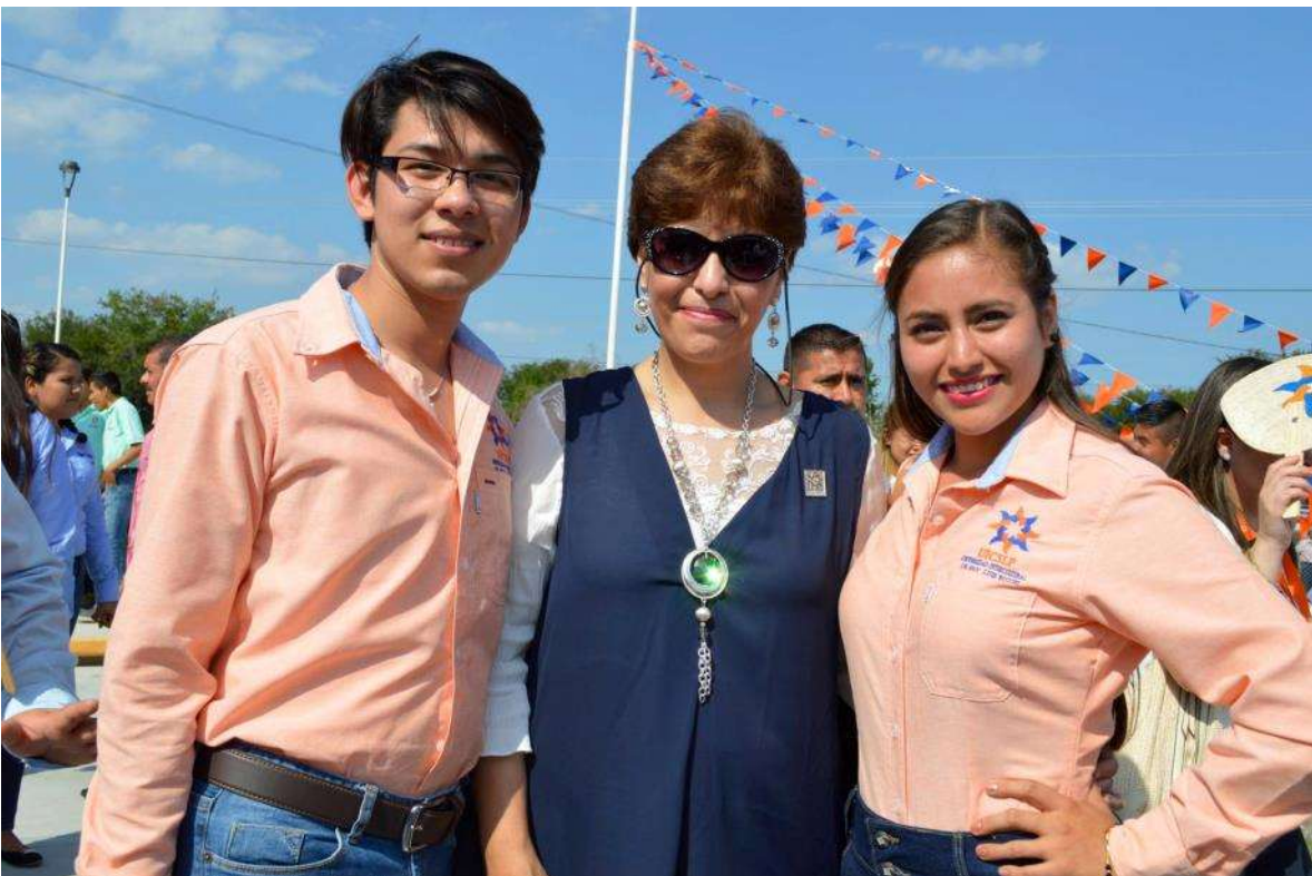
Comunidad Universitaria Tamuín, fuente archivo.

La institución entiende por interculturalidad un “momento social” de construcción de una renovada identidad integradora que pretende reconciliar los saberes ancestrales con las sociedades de conocimiento. Una articulación de valores filosófico-sociales que pueden ser catalizadores de una redistribución de los valores económicos, tecnológicos y sociales.