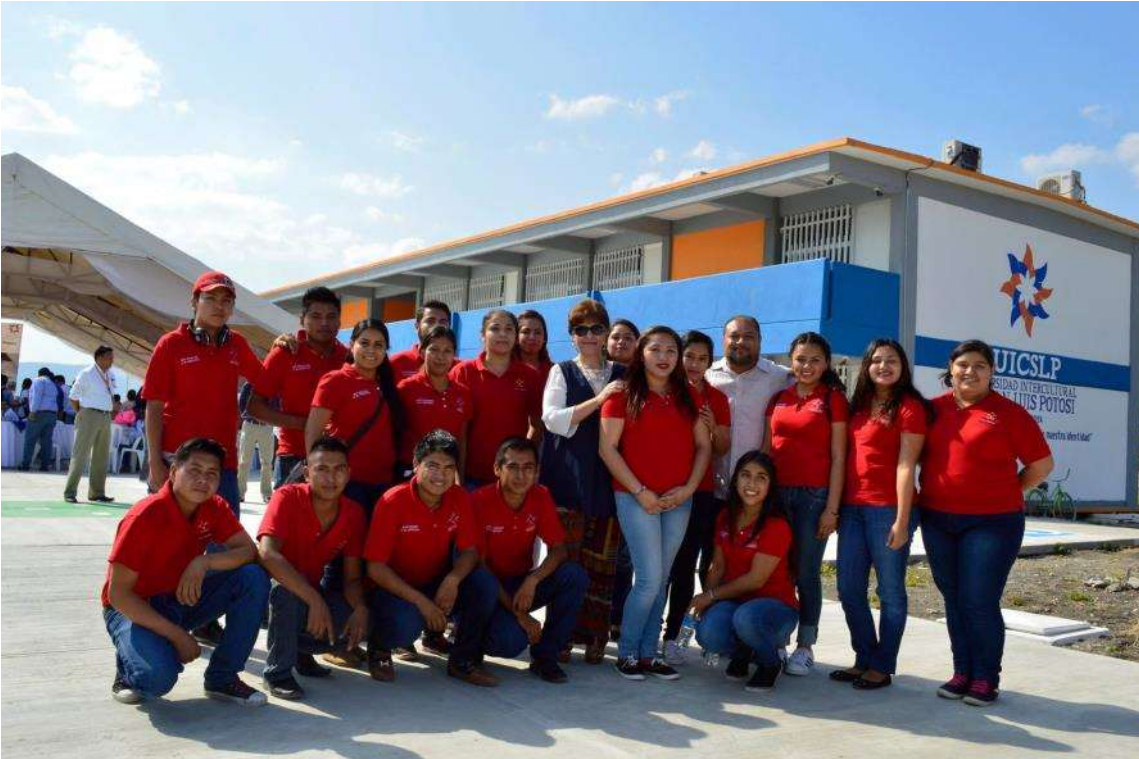
Comunidad Universitaria Tamuín, fuente archivo.