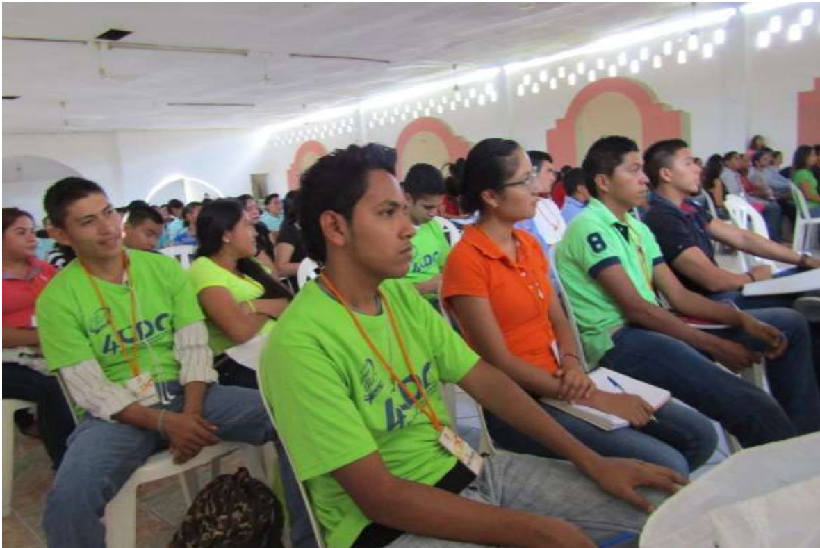
Alumnos de Ingeniería Industrial Tamuín, fuente archivo.