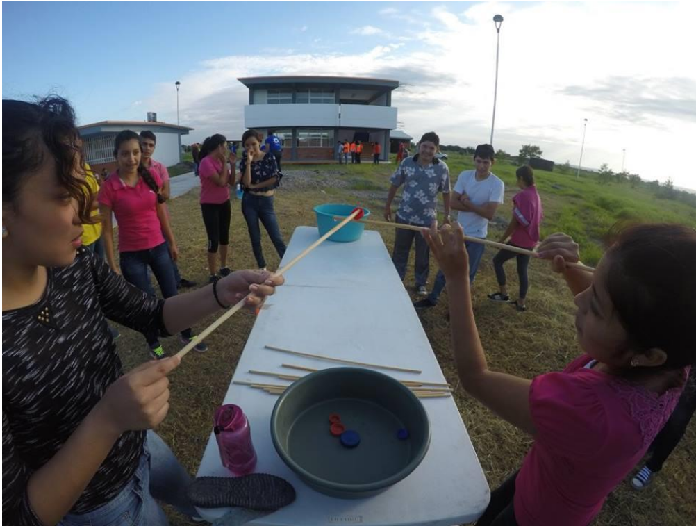
Actividades extracurriculares Unidad de Tamuín, fuente archivo.