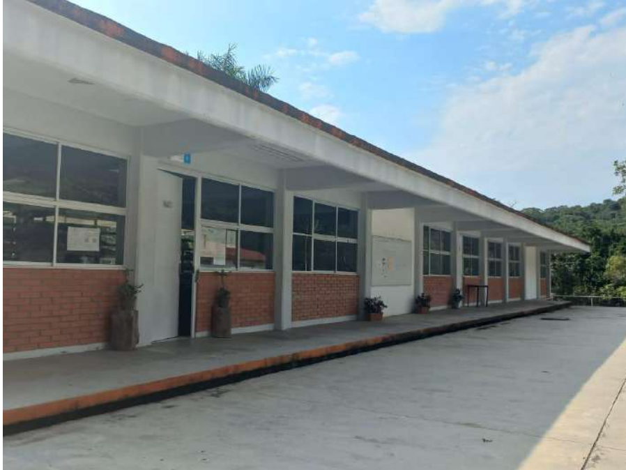
Fig. Instalaciones Tancahuitz.