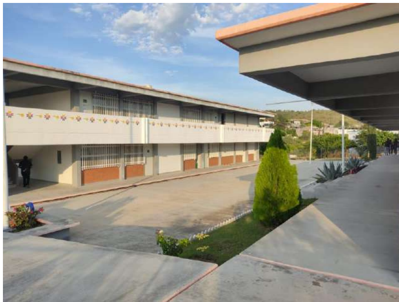
Fig. Instalaciones Cerritos.

La infraestructura genera 150 espacios en el ciclo escolar 2022-2023 se utilizó al 122 por ciento la infraestructura; con esta se da atención al 3.1 por ciento de los egresados de educación media superior de la microrregión media oeste.