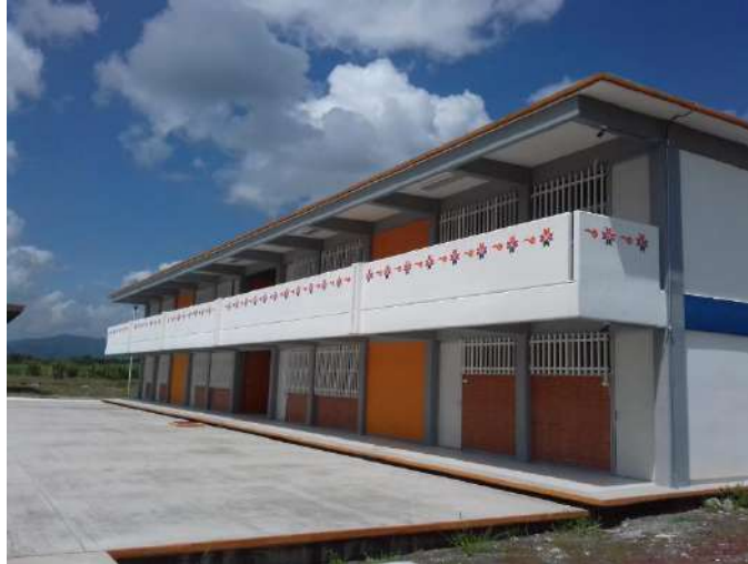
Fig. Instalaciones Ciudad Valles.

La infraestructura genera 420 espacios en el ciclo escolar 2022-2023 se utilizó al 86.6 por ciento la infraestructura, con esta se da atención al 2.5 por ciento de los egresados de educación media superior de la microrregión huasteca norte.