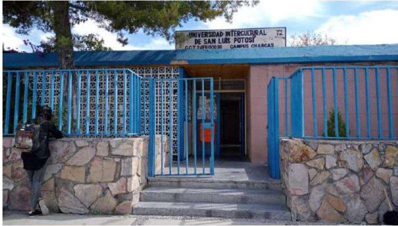
Fig. Instalaciones Charcas.