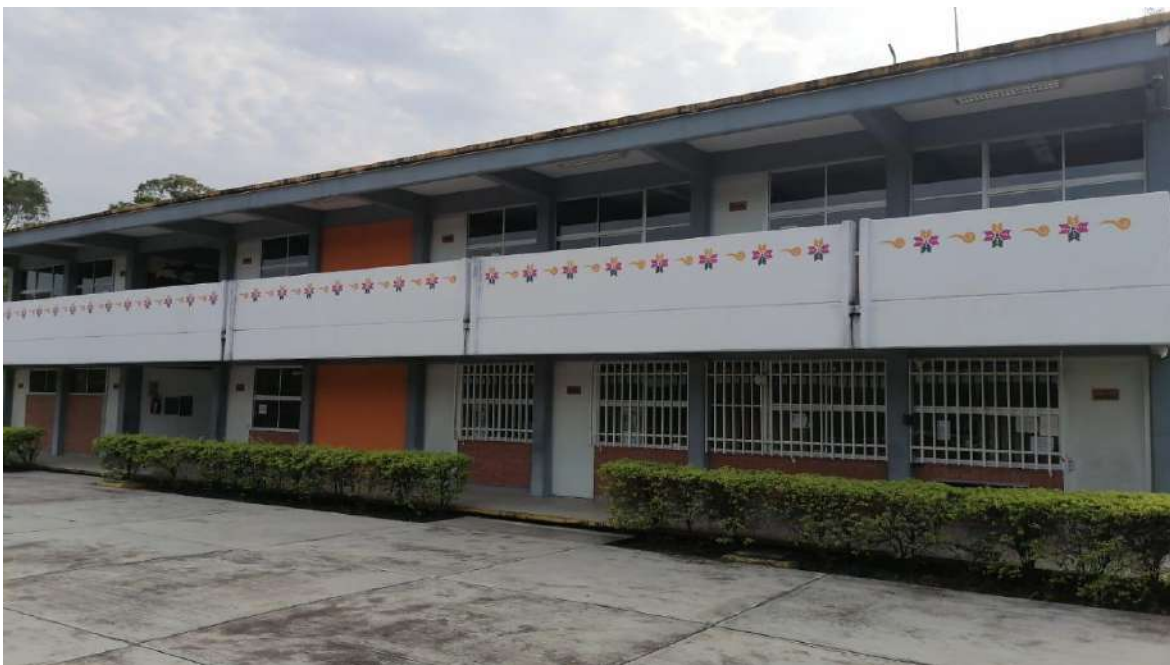
Fig. Instalaciones Tamazunchale.