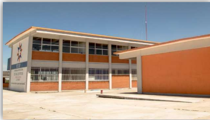
Fig. Instalaciones Villa de Reyes.

Así la situación de la infraestructura de la Universidad Intercultural de San Luis Potosí es reflejo de una inversión realizada de 2011 a 2022 de distintos fondos; en la gráfica posterior se refiere la inversión del periodo: