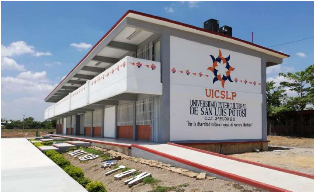
Fig. Instalaciones Tanquian de Escobedo.

En la siguiente liga puede ubicar el domicilio de la unidad https://www.google.com/maps/place/Universidad+Intercultural+de+San+Luis+Potos%C3%AD,+Unidad+Acad%C3%A9mica+Tanqui%C3%A1n+de+Escobedo/@21.613605,-98.661144,347m/data=!3m1!1e3!4m5!3m4!1s0x0:0xfea91ba3dc6acd6c!8m2!3d21.6136053!4d-98.6611445?hl=es-ES