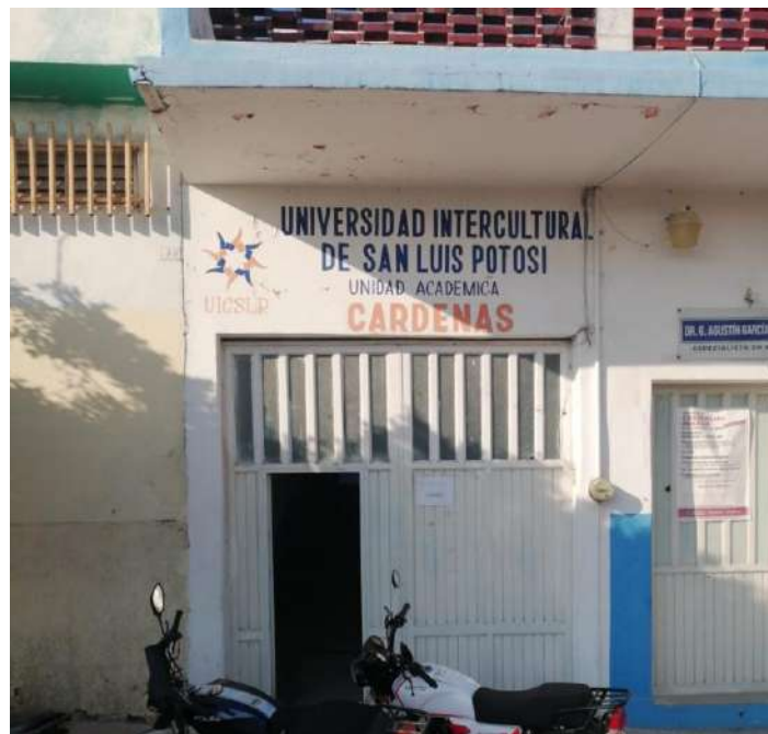
Fig. Instalaciones Cárdenas.

La infraestructura genera 150 espacios en el ciclo escolar 2022-2023 se utilizó el 88 por ciento de esta capacidad; para dar atención al 5.71 por ciento de los egresados de educación media superior de la microrregión altiplano centro.