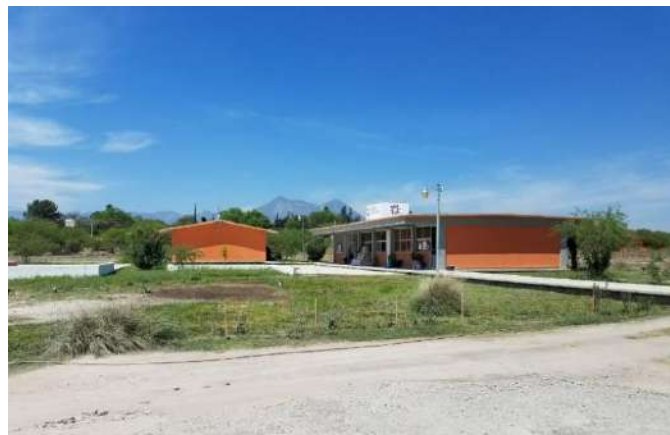
Fig. Instalaciones Matehuala.

La infraestructura genera 30 espacios en el ciclo escolar 2022-2023 se utilizó al 403 por ciento la infraestructura, existiendo un sobre cupo; con esta se da atención al 2.3 por ciento de los egresados de educación media superior de la microrregión altiplano este.