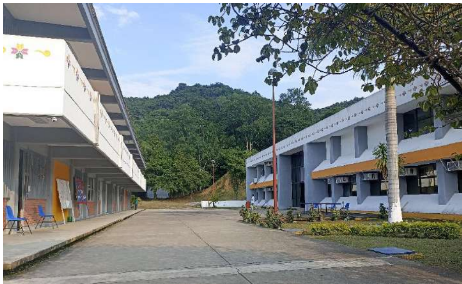
Fig. Instalaciones Matlapa.

La infraestructura genera 660 espacios en el ciclo escolar 2022-2023 se utilizó al 113.9 por ciento la infraestructura, existiendo un sobre cupo; con esta se da atención al 6.9 por ciento de los egresados de educación media superior de la microrregión huasteca sur.