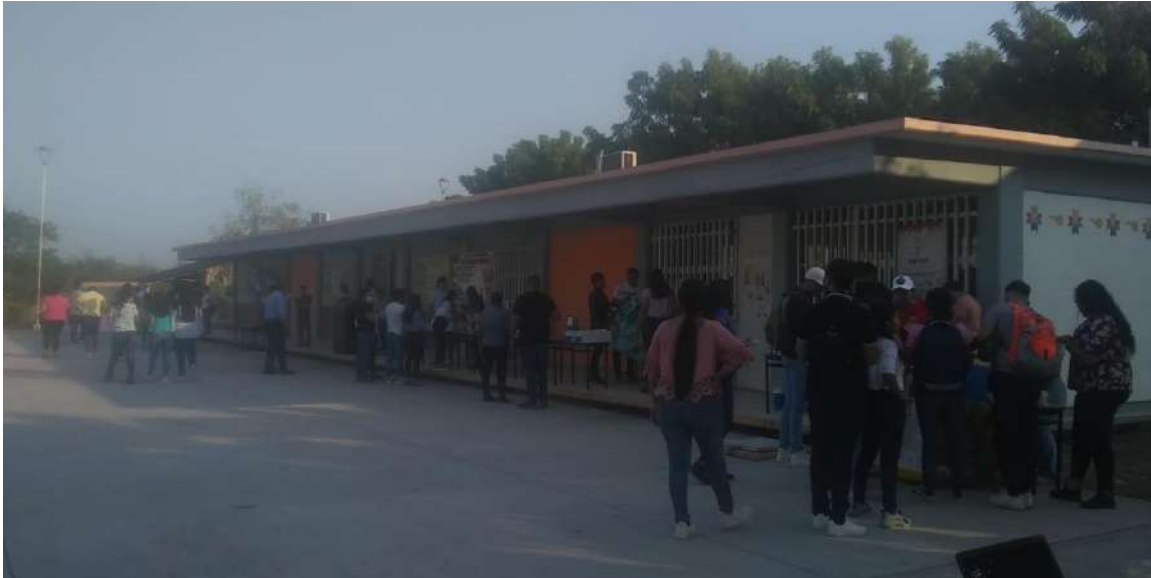
Fig. Instalaciones Tamuín.

La infraestructura genera 270 espacios en el ciclo escolar 2022-2023 se utilizó al 152.9 por ciento la infraestructura, existiendo sobre cupo; con esta se da atención al 2.9 por ciento de los egresados de educación media superior de la microrregión huasteca norte.