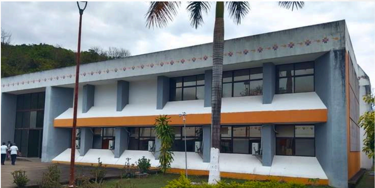
Imagen X: UA Matlapa

Dicho Plan Maestro se encuentra alineado con los objetivos de desarrollo nacional, estatal e institucional, buscando garantizar el derecho a una educación superior de calidad mediante el fortalecimiento sistemático de las condiciones materiales y académicas de sus planteles.