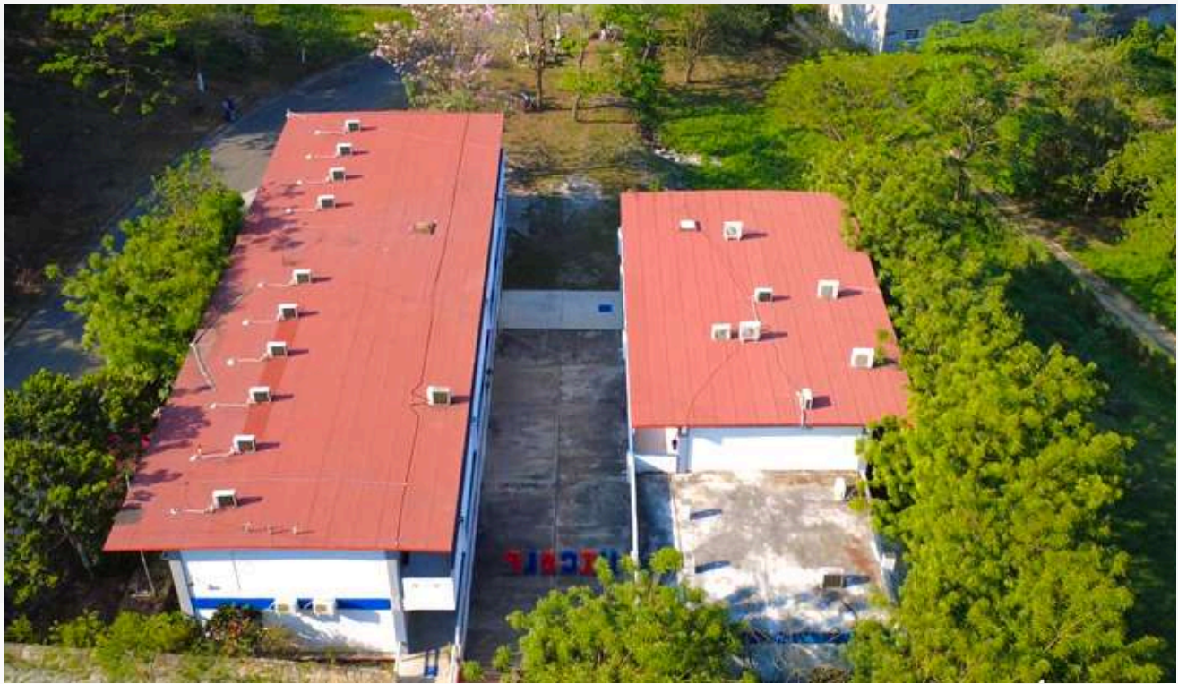
Imagen X: UA Tancanhuitz

Entre 2011 y 2025, la Universidad ha recibido una inversión acumulada en subsidio ordinario por $579,435,918.07 pesos, destacando el ejercicio 2025 como el de mayor financiamiento histórico, con un total de $51,255,172.00 pesos.