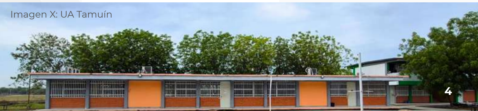
Imagen X: UA Tamuín