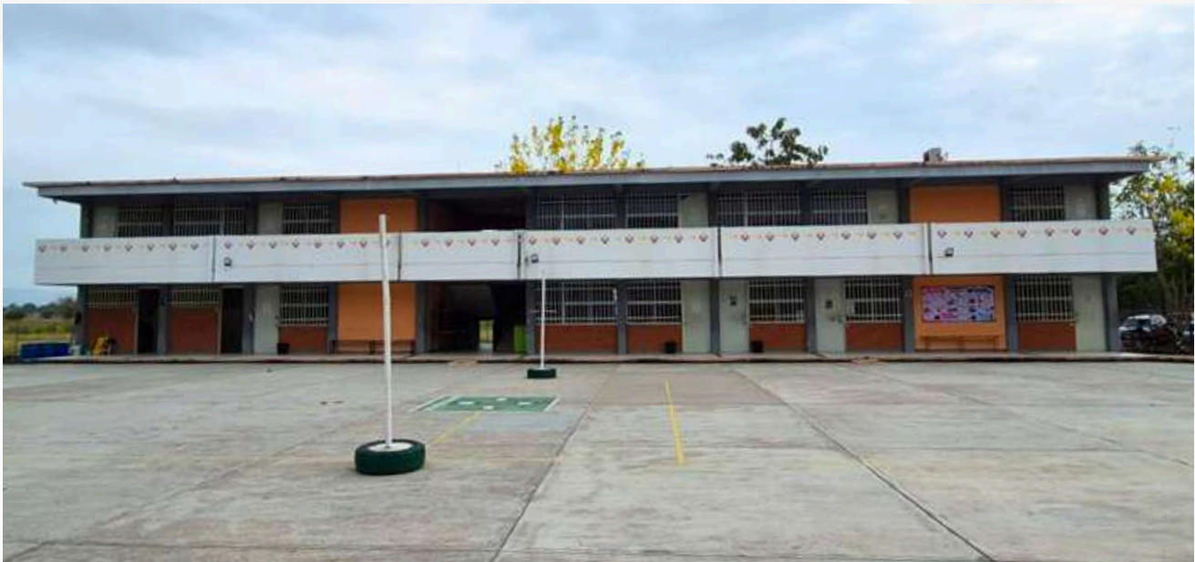
Imagen X: UA Tamuín

El fortalecimiento de la infraestructura institucional también permite ampliar la vinculación con sectores productivos, sociales y gubernamentales. Actualmente, la Universidad cuenta con 88 convenios vigentes con diversas instituciones y organismos , lo que contribuye al desarrollo regional mediante la aplicación práctica del conocimiento generado en espacios académicos adecuados y equipados.