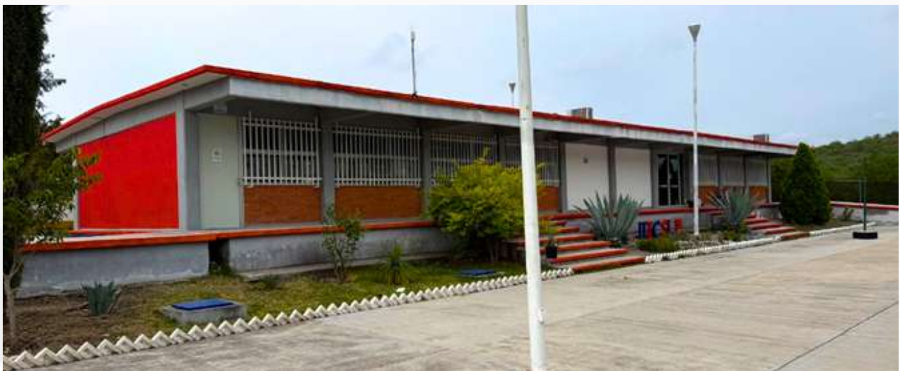
Imagen X: UA Cerritos