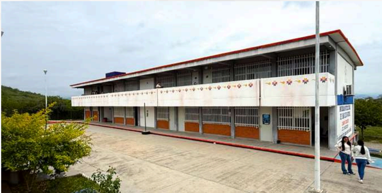
Imagen X: UA Cerritos

La Universidad mantiene presencia en once Unidades Académicas ubicadas en los municipios de Cárdenas, Cerritos, Ciudad Valles, Charcas, Matehuala, Matlapa, Tanquián de Escobedo, Tamuín, Tamazunchale, Tancanhuitz y Villa de Reyes.