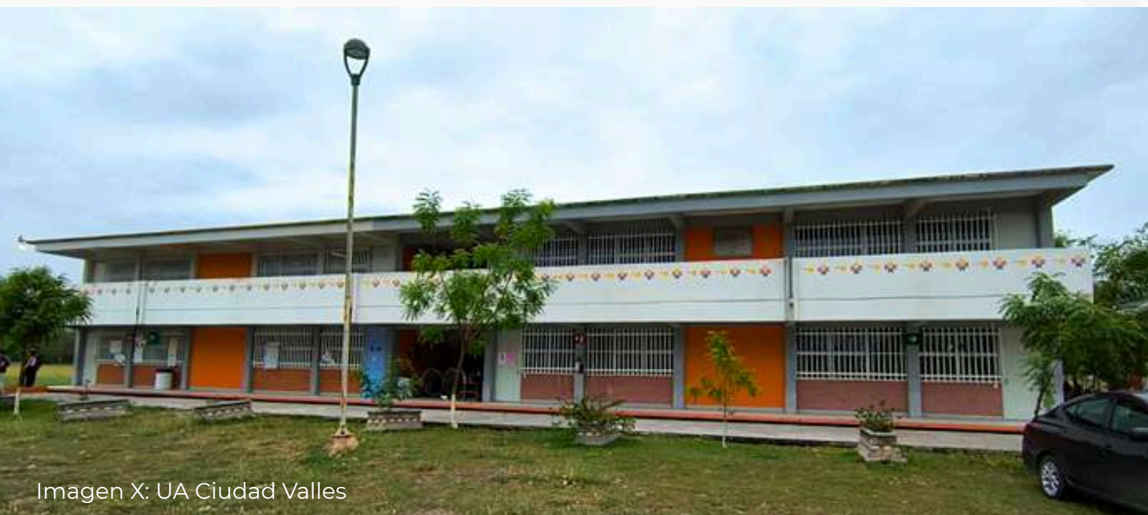
Imagen X: UA Ciudad Valles